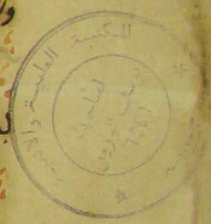
B.3. (Q/ق) copy: K. al-Nikāh

٤٨ امارة واشترى لها دارها فالله اذ كان في عفة النكاح قلته قبل نحو هذه الشرك بعد عفة النكاح اذ الم تكن المارة اشترى كنه في عفة النكاح فالله اذ اجوزه واجوزة ان يشترى بعد النكاح وكل بشر كانه قبل عفة النكاح بعد الذي عزم جازين وليس له ان يشترى بل يزوج وانما يلزم من الشرك ما كان في عفة النكاح او بعد ما قام به في ذلك من وصية له وهذا ان كتاب النكاح من قول الربيع بن ابي نوح هاج الاهان وابي عبيدة مسيما بن ابي نوح بالانار التي مسددها القياس الذي ايجتاج في العفول وما يجتاج علمه في النكاح وهو يسمى كتاب الشغار والشغار ان يزوج الرجل ابنته ويزوج الابن ابنته ولا يسمى به مهر ابنته ما يصير كانه بدل بدل وهو نكاح فاسد اذ اكان ذلك في علمه اسما على علمه في علمه ذنوبه والسكنه حتمه في علمه الله علمه مسد ما يجز بسم الله الرحمن الرحيم في بيان النكاح من قول جابر بن عبد الله بن جابر لقد ابا اجل من النكاح وما يجز منه مما افنا فيه جابر بن عبد الله بن جابر الله واحضوا وصية الله في النساء واعلموا انه لا نكاح الا باذن الولي واما امارة فحتمه بعين اذن الولي فان ذلك هو الولي بعينه ذلك اذا اطلق الا ان تكون امارة لاولي لها فتاتي قاضي المسلمين فينتج باذنه او توليه امر خارجا عن المصلح من غير وجه من فرغ به بالمهر والبيته لا يجوز النكاح الا بالمهر وان قالوا ان الناس عليه من قليل المهر وكثيره فهو جائز واما امارة تزوجه بعين اذن الولي في بيتهما وما يجتاج علمه حال اذ اكان قد دخل بها ولها مهر مثلها وان لم يكن قد دخل بها جاز ذلك لاوليها وحدثه