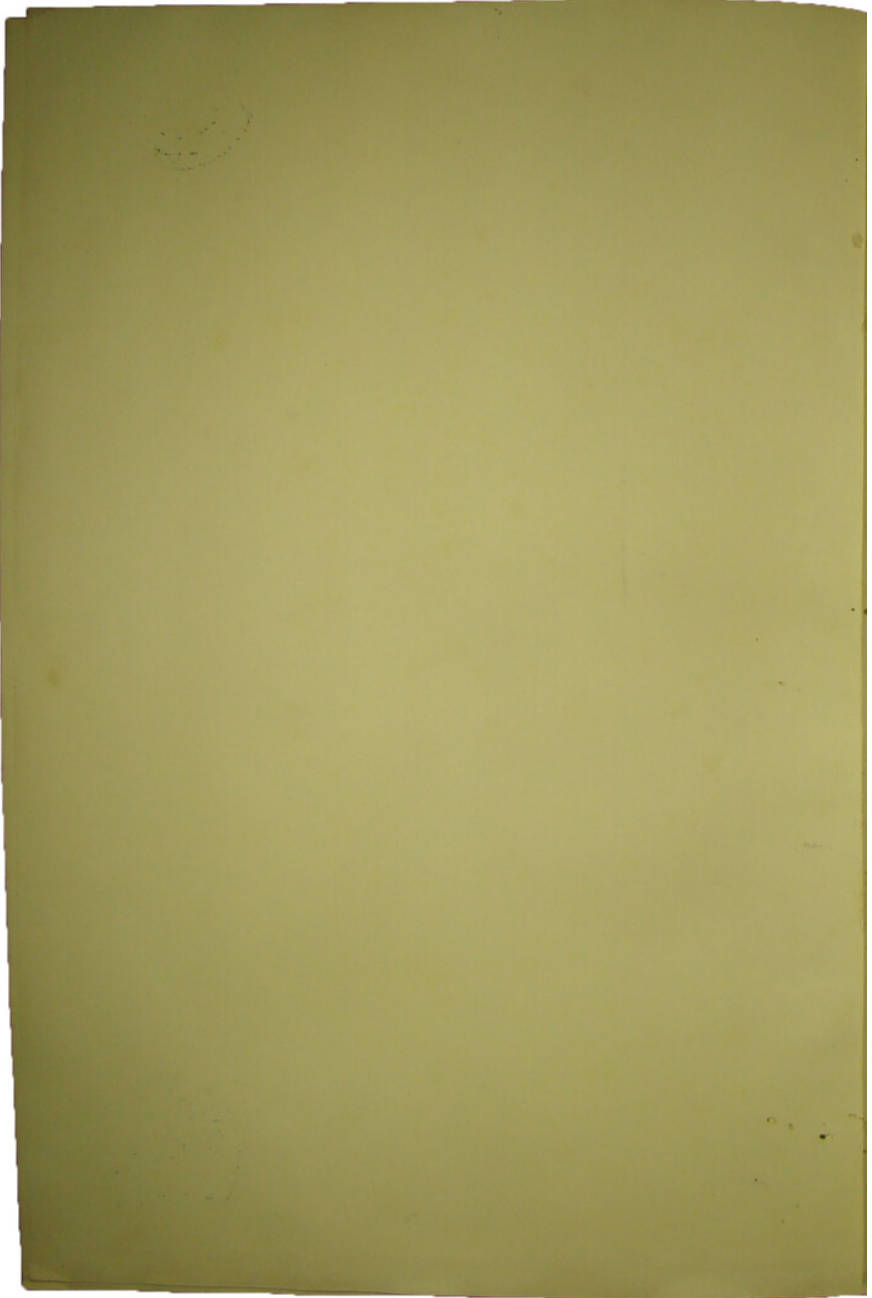
B.2. (B/ب) copy: K. al-Nikāh