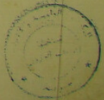
B.z. (B/ب) copy: K. al-Nikāh