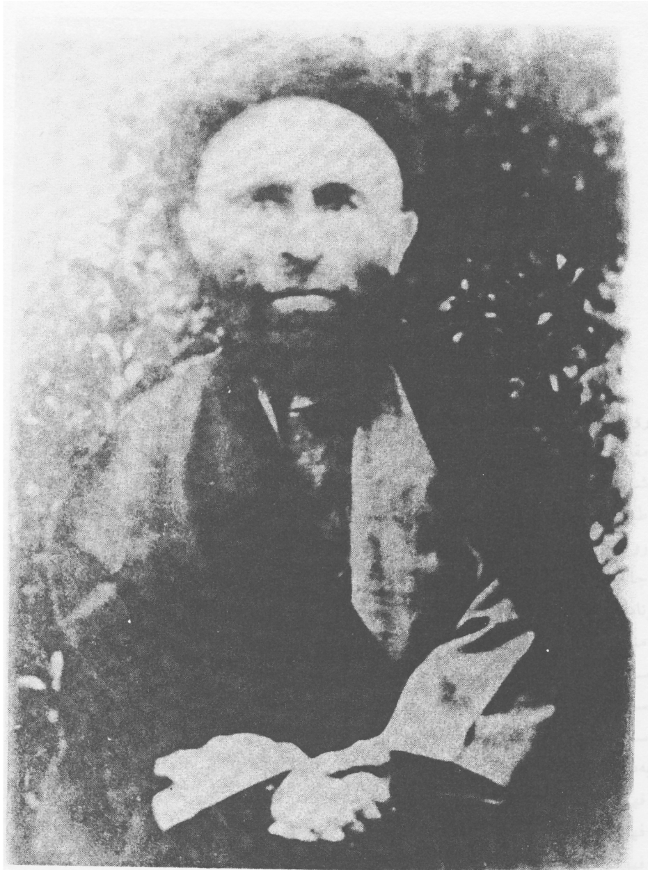
آیت الله سید محمد تقی مطهری بنیانگذار مدرسه امام صادق (ع) چالوس