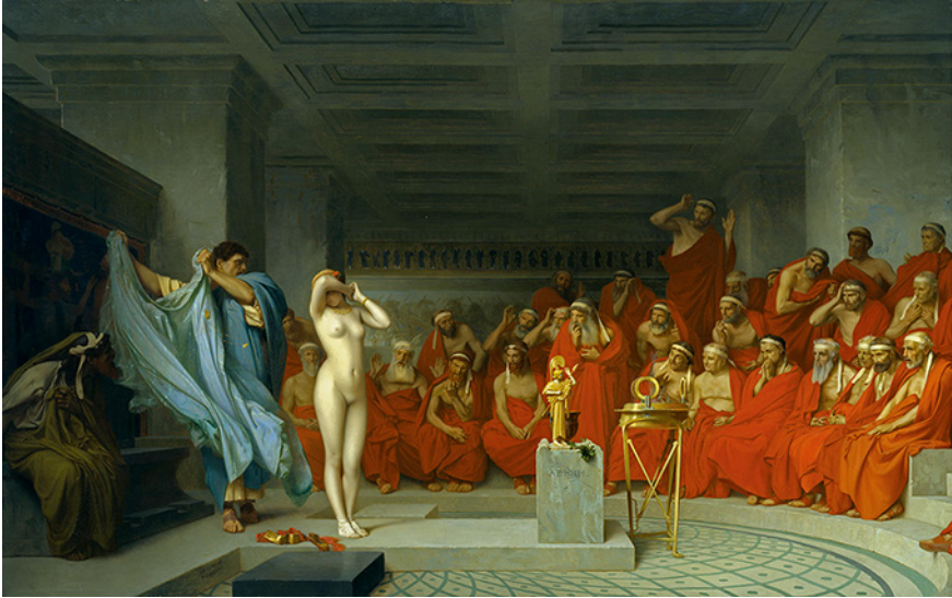
Abb. 10.1 Jean-Léon Gérôme, Phryne vor den Richtern (1861).

Form eines staunenden Erzählens von Phryne an das ‚richtige‘ Objekt, nämlich ebendie ungeschminkte, oder besser: die nackte Phryne.