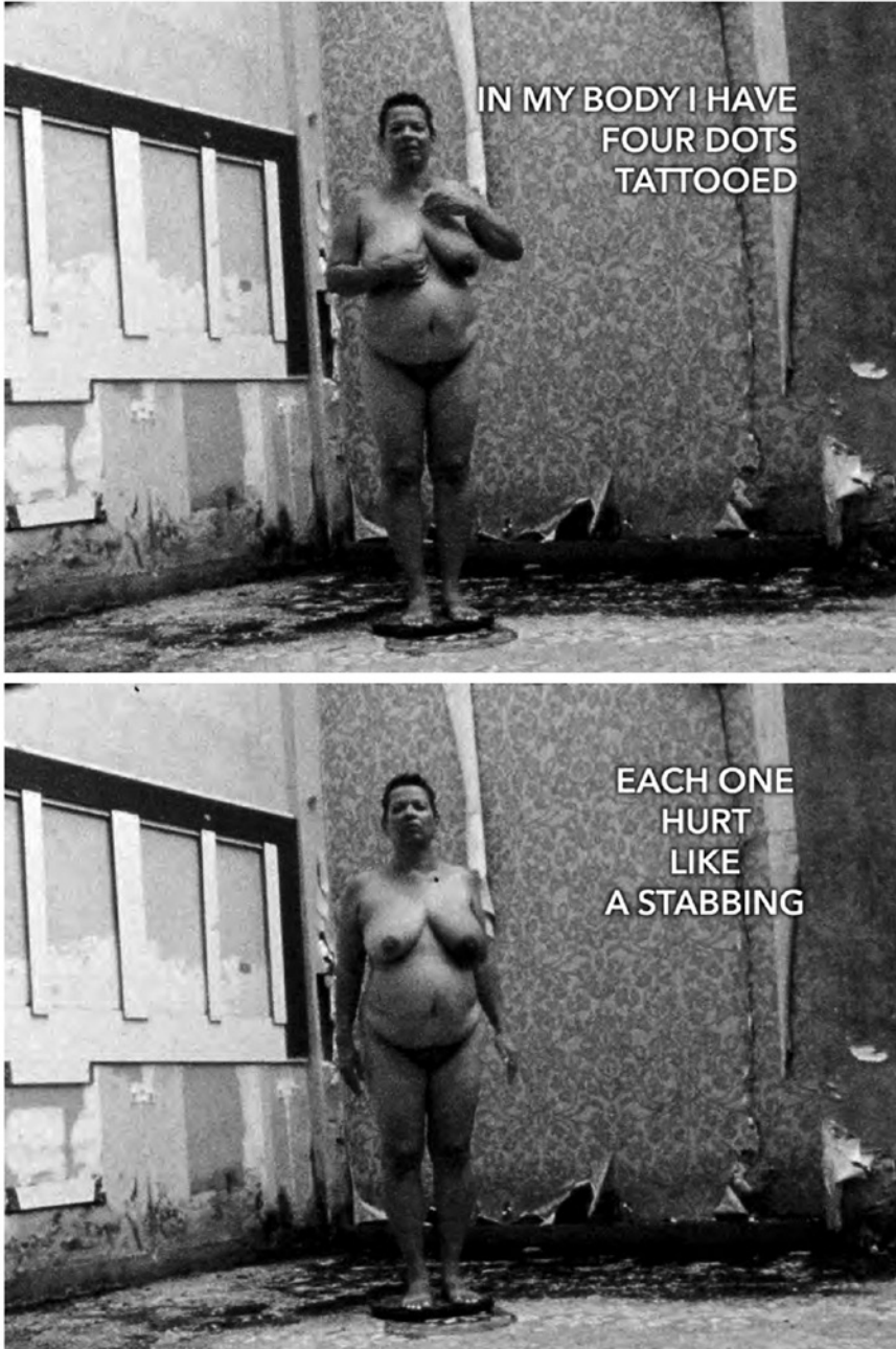
Abb. 8.2