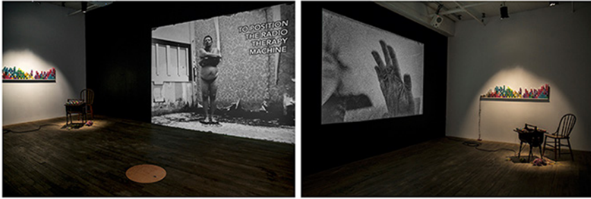
Abb. 8.1