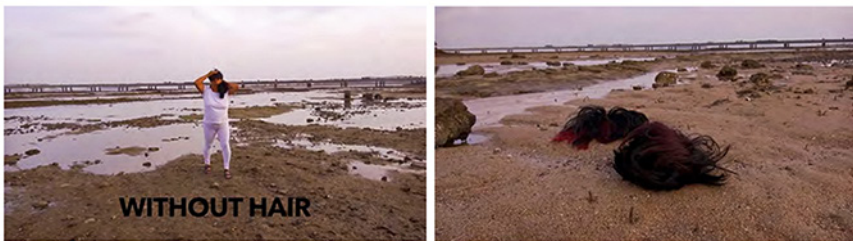
Abb. 8.7

Sie setzt sich gleichzeitig aber im Bild eine Perücke auf, nur um sie dann nach wenigen Schritten bereits wieder abzuwerfen, weil sie sie schon nicht mehr braucht.