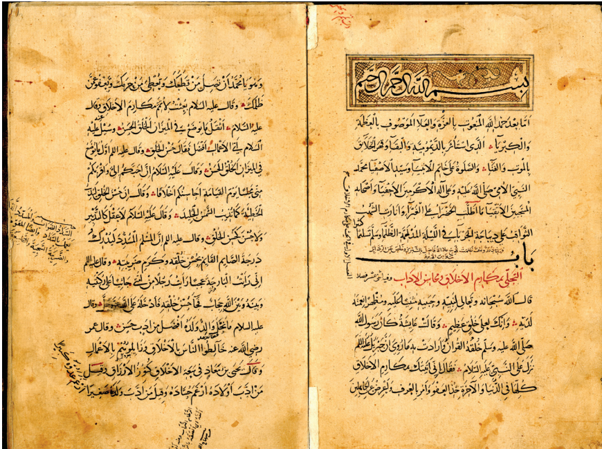
Ms Leiden Or. 300f. 2v-3r