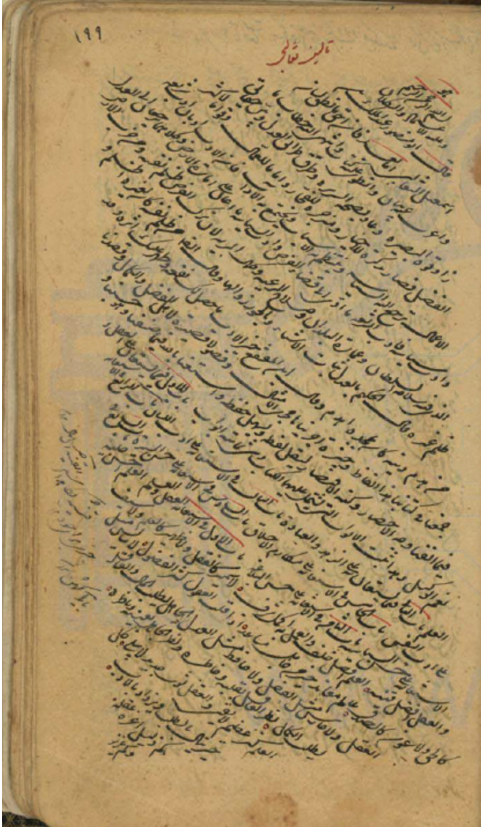
MS Majlis-i Shura-yi Milli 1749/9, f 105r

al-ādāb , dated 1809 and copied by ‘Abdallāh b. Muḥammad al-Ghālībī. Two manuscripts attributed to Tha‘alībī bearing the same title, Qalā’id al-albāb wa-fawā’id al-ādāb , are housed in Mu’assasat al-Imām Zayd b. ‘Alī in Yemen.