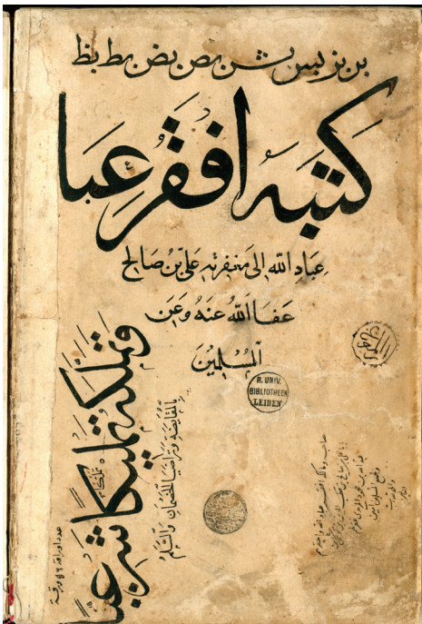
Ms Leiden Or. 300f. 55v