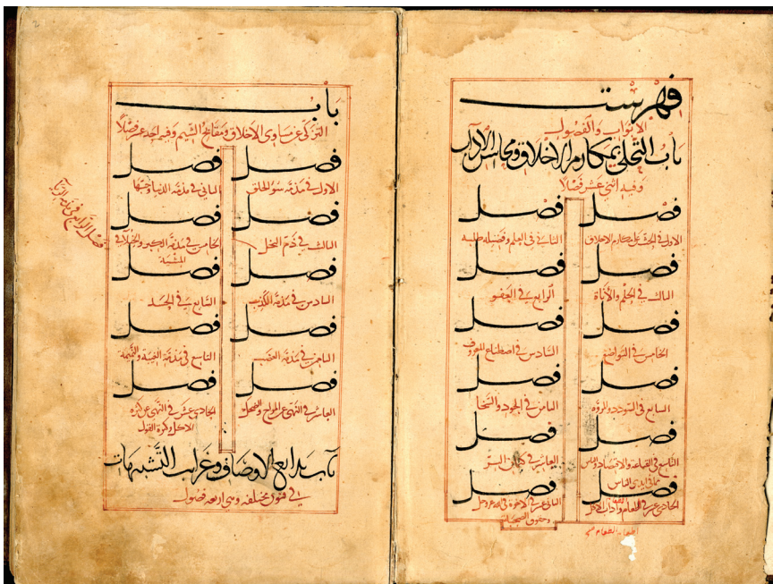
MS Leiden Or. 300 f. 1v-2r