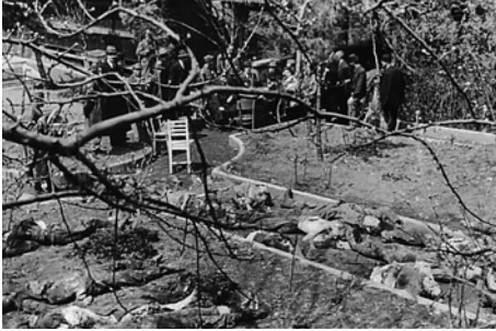
Abbildung 3 Exhumierung der Opfer vor der Villa Volkert 263